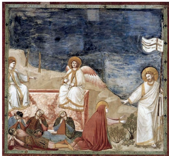
Giotto di Bondone: Auferstehung, Fresko von 1304